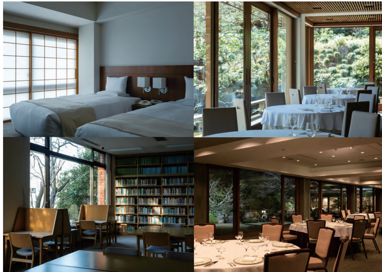
左上 / 住宿設施，左下 / 圖書室，右上 / 餐廳 SAKURA，右下 / 宴會廳