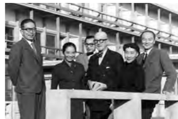
圖為作為國立西洋美術館的設計擔當來日的建築師勒柯比西耶，在學生前川和坂倉的帶領下參觀了會館 (1955 年)