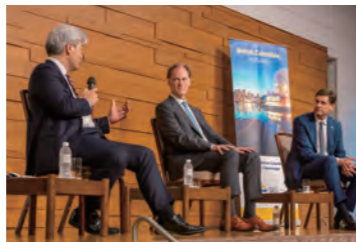
地經學研究所「加拿大不列顛哥倫比亞省省長和加拿大駐日大使研討會」

國際文化會館，作為亞太地區的思想交流樞紐，是一個民間非營利組織機構。會館以國際關係・地域研究、地理政治學、社會體系・治理・創新、文明論・哲學、藝術・設計等項目作為主軸，致力於促進自由、平等、開放的交流和開創可持續發展的未來。