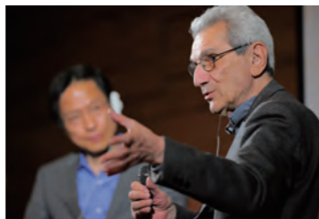
因汲取世界智慧項目受邀來日的思想家安東尼奧・奈格里