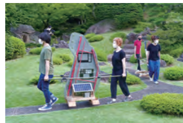
2020 年日美藝術家交流項目庭園展示「旅居—The Journey Itself Home」